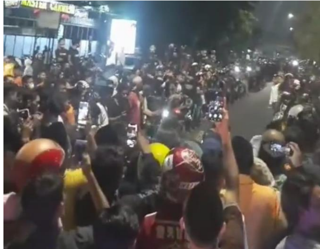
Gambar 3 Suasana Balapan Taruhan antar Kelompok

beradu. Para penonton berbondong-bondong untuk mendapatkan tempat yang paling dekat dari lintasan balapan liar dengan memarkir kendaraannya berada paling depan bibir lintasan. Maka tidak jarang lintasan balap menjadi sangat sempit untuk kedua pengendara yang sedang beradu. Hal itu terjadi karena dalam balapan liar taruhan hanya dilakukan sekali tancapan gas dan kedua motor balap langsung meninggalkan lintasan.