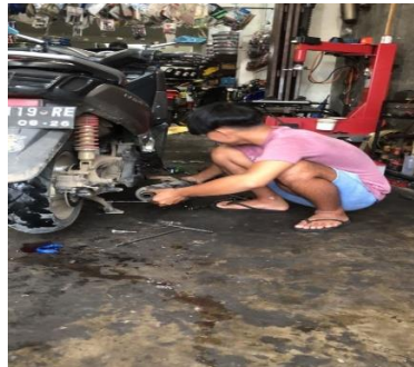
Gambar 2 Kegiatan pada Bengkel

balapan liar tidak beroperasi dengan orientasi mengikuti pedoman lalu lintas ataupun kelompok-kelompok yang berorientasi pada kebebasan individu dalam bentuk apapun—kriminalitas selain pada minat seputar balapan. Kelompok balapan liar memiliki orientasi yang jelas hanya pada reparasi dan adu kecepatan pada sepeda motor. Kegiatan yang dilakukan di bengkel biasanya meliputi kerja-kerja reparasi sepeda motor, baik dari pelanggan bengkel maupun kendaraan anggota kelompok. Perkumpulan pada bengkel dapat membantu kerja-kerja operasional bengkel tersebut. Bengkel menjadi tempat pertukaran pengetahuan tentang sepeda motor pada kelompok.