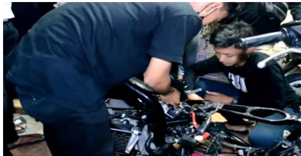
Gambar 4 Pelaksanaan Skrut setelah Prosesi Balapan Liar.

Apabila terdapat pihak yang tidak membayar taruhan yang sudah disepakati biasanya menghadirkan pertengkaran antar kedua pihak dan akan diberi sanksi sosial dalam subkultur balapan liar di Kota Makassar. Namun tidak menutup kemungkinan dalam penyelesaian dilakukan dengan mengambil jalur hukum formal. Sanksi yang tegas juga bisa saja diambil oleh pihak yang merasa dirugikan walau harus berdampak juga pada pihak yang memberi sanksi. Balapan liar dengan perjanjian juga memiliki dua sistem kerja. Sistem skrut merupakan sistem pengecekan spesifikasi sepeda motor. Pengecekan dilakukan untuk menyesuaikan antara spesifikasi pada saat perjanjian dan pada saat balapan terjadi. Pengecekan dilakukan kepada pihak yang memenangkan balapan. Sistem skrut biasanya dilakukan dengan taruhan besar karena membutuhkan tenaga yang besar pula. Skrut dilakukan di bengkel ataupun tempat pihak yang kalah berkumpul. Hadirnya sistem skrut didasari pada beberapa kejadian dan kebiasaan dalam adu balapan sepeda motor.