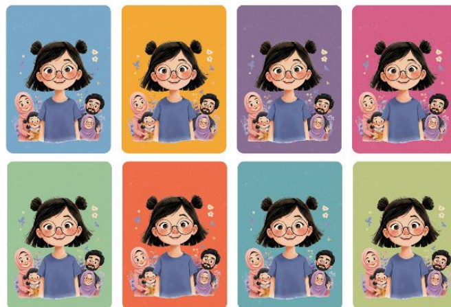
Gambar 1. Kartu Tampak Depan

Pada tahap design , dirancang modul permainan Lakuartha: QK yang terdiri atas kartu situasi dan buku cerita reflektif berjudul La Ressa . Kartu situasi memuat permasalahan kontekstual yang berkaitan dengan interaksi anak dengan orang yang lebih tua serta pilihan sikap tersebut sehingga anak dapat memahami konsekuensi moral dari setiap tindakan. Berikut gambaran beberapa halaman dari modul permainan Lakuartha: QK .