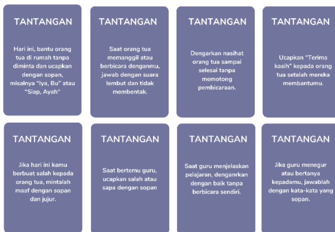
Gambar 3. Kartu Tantangan