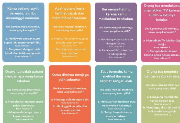
Gambar 2. Kartu Situasi