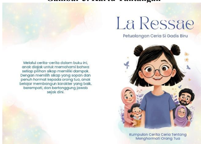
Gambar 4. Cover Buku La Ressaë