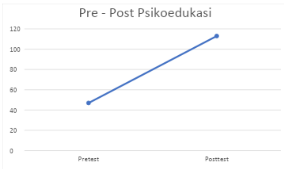
Gambar 2. Perubahan Skor Kompetensi Sosial Anak Usia Dini Sebelum dan Sesudah Psikoedukasi Berbasis Bermain

Grafik batang menunjukkan perbedaan yang cukup mencolok antara skor pretest dan posttest. Skor pada tahap pretest berada pada tingkat yang lebih rendah, yang mencerminkan bahwa kompetensi sosial anak sebelum intervensi masih belum berkembang secara optimal. Setelah mengikuti psikoedukasi, skor posttest mengalami peningkatan yang signifikan, yang menunjukkan adanya perkembangan kemampuan sosial anak.