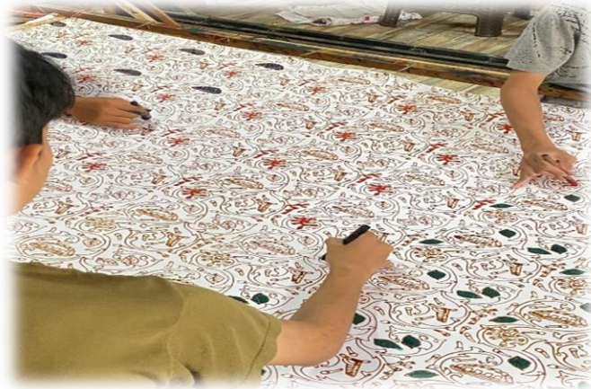
Gambar 3. Proses pengerjaan batik tulis motif parijoto Kudus

Menurut Vita, motif Parijoto sekarang lebih banyak menggunakan warna-warna cerah dan pastel daripada warna tradisional yang lebih kelam. Mereka juga tetap mempertahankan kelembutan khas batik Kudus. Menurut studi estetika kriya, inovasi warna dapat meningkatkan daya tarik visual motif tradisional dengan mempertahankan kesatuan dan harmoni desain (Larasati et al., 2025). Perubahan pilihan warna ini juga menunjukkan upaya perajin untuk memenuhi permintaan konsumen yang lebih luas sambil mempertahankan nilai budaya sebagai identitas kreatif batik Kudus.