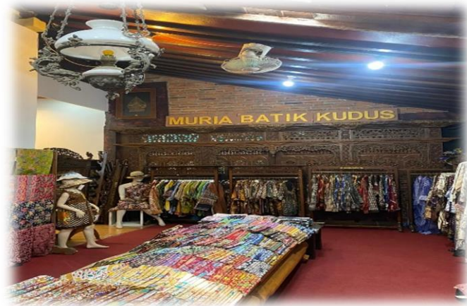
Gambar 5. Produk Batik Parijoto Kudus siap pakai

Motif Parijoto mudah diterapkan ke berbagai media karena bentuknya yang teratur, repetitif, dan fleksibel. Penelitian etnomatematika menemukan bahwa motif flora dapat dengan mudah diubah tanpa kehilangan identitasnya jika digunakan pola teratur. Motif dapat diterapkan pada pakaian, aksesoris, dan dekorasi interior karena fleksibilitas ini tanpa mengurangi karakteristik estetika aslinya. Pengulangan pola yang konsisten juga membantu mempertahankan ritme visual, yang membantu motif tetap konsisten saat disesuaikan dengan berbagai bentuk dan ukuran media. Dengan kemudahan adaptasi ini, perajin dapat mengembangkan produk kreatif kontemporer sambil mempertahankan identitas budaya. Menurut Utami et al., (2021), motif Parijoto memiliki nilai budaya dan fungsi estetika yang relevan dengan tren desain kontemporer.