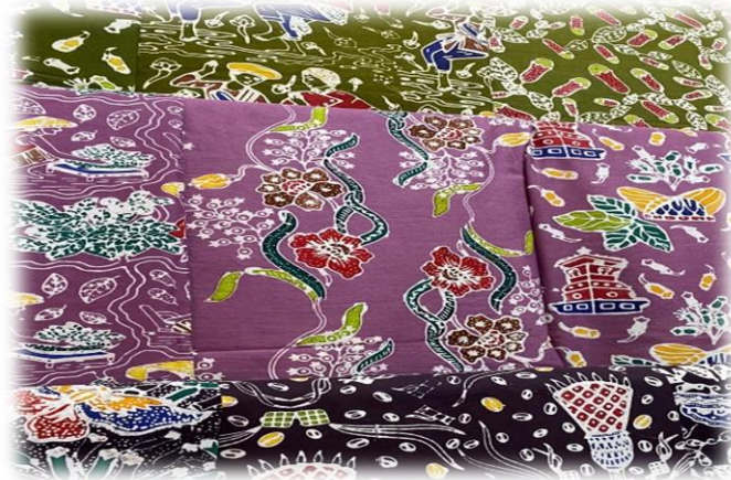
Gambar 4. Detail visual motif batik Parijoto Kudus

Hasilnya menunjukkan bahwa masyarakat Kudus melihat buah Parijoto sebagai simbol harapan baik, terutama dalam tradisi tujuh bulanan, di mana mereka mendoakan keselamatan dan kebaikan bagi ibu dan janin. Kepercayaan ini menunjukkan bahwa Parijoto dipahami sebagai bagian dari sistem nilai dan kepercayaan masyarakat selain sebagai buah lokal. Ini sejalan dengan penelitian yang dilakukan oleh Yelli et al. (2022) yang menemukan bahwa flora tradisional Nusantara biasanya mengandung pesan simbolik seperti doa, perlindungan, dan harapan untuk penerus. Oleh karena itu, motif Parijoto digunakan dalam batik sebagai representasi visual dari nilai budaya dan spiritual yang ada dalam masyarakat Kudus.