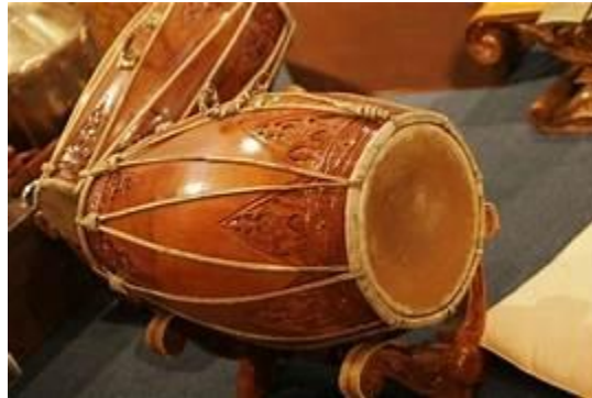
Gambar 6. Kendang Ageng (sumber :Wicaksono & Mariasa, 2024).

yang menarik ini tidak hanya memikat perhatian peserta didik, tetapi juga berfungsi sebagai media untuk mengenalkan konsep estetika, seperti bentuk, tekstur, dan keseimbangan visual, dalam pembelajaran seni budaya (Bakti et al., 2025).