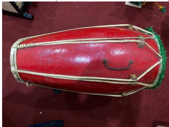
Gambar 7. Kendang Ciblon atau Kendang Batang

Salah satu bentuk visual Kendang ageng atau kendang bem merupakan jenis kendang dengan ukuran paling besar dibandingkan jenis kendang lainnya. Dari sudut pandang estetika, kendang ageng memiliki tingkat kerumitan yang tinggi dalam proses pembuatannya. Hal ini tampak tidak hanya pada bagian luar yang dihiasi dengan pola ukir-ukiran, tetapi juga pada bagian dalam kendang yang dirancang memiliki ruang resonator bunyi. Ruang resonator tersebut berfungsi untuk mengatur dan memperkuat kualitas bunyi yang disesuaikan dengan karakter serta ukuran kendang. Keunikan lain dari kendang ageng terletak pada tebakan kulit yang melapisinya, yang menghasilkan karakter bunyi menep, sareh, dan mantep. Dalam pertunjukan karawitan, kendang ageng berperan sebagai pengendali karakter gending yang bersifat agung dan berwibawa. Secara estetis, bentuk dan ukuran kendang ageng mencerminkan tanggung jawabnya dalam mengiringi gending atau lagu yang memiliki karakter berat dan penuh kewibawaan (Wicaksono & Mariasa, 2024).