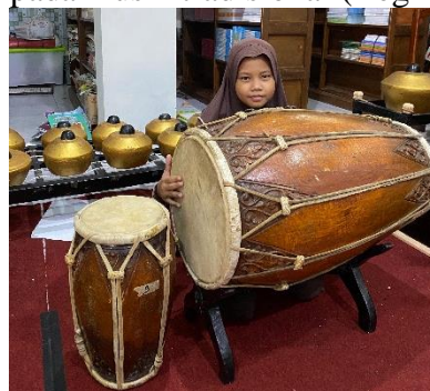
Gambar 4. Peserta Didik SD 1 Barongan Kudus

Tahap selanjutnya, guru mengarahkan peserta didik untuk mempraktikkan teknik dasar menabuh kendang melalui pola irama sederhana yang disesuaikan dengan perkembangan kemampuan motorik dan kognitif siswa sekolah dasar. Proses pembelajaran dilaksanakan secara bertahap dan berulang agar siswa terbiasa mengenali karakter bunyi kendang serta mampu menjaga konsistensi ritme. Melalui pengalaman praktik secara langsung, keterampilan musikal dasar siswa dapat berkembang dengan baik. Pendekatan ini sejalan dengan pembelajaran seni musik berbasis budaya yang menekankan keaktifan siswa dalam menghasilkan bunyi dan ritme pada musik tradisional (Regina et al., 2025).