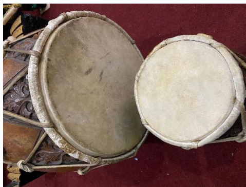
Gambar 5. Muka atau Membran Kulit Kendang

Ditinjau dari aspek auditif, kendang mampu menghasilkan ragam bunyi yang bervariasi, mulai dari nada rendah hingga tinggi serta dari tabuhan yang lembut sampai keras. Variasi bunyi tersebut membentuk irama dan dinamika yang melatih kepekaan pendengaran peserta didik terhadap karakter musik tradisional. Melalui pengalaman mendengarkan dan memainkan kendang, siswa tidak hanya belajar mengenali perbedaan bunyi, tetapi juga memahami pola ritme, tingkat intensitas, serta keselarasan bunyi sederhana yang menjadi ciri khas musik tradisi. Pengalaman auditif ini memberikan pengalaman estetis yang bermakna, karena peserta didik diajak merasakan bunyi sebagai unsur keindahan musik, sehingga secara bertahap mampu menumbuhkan apresiasi musikal dan rasa penghargaan terhadap kekayaan bunyi dalam seni musik tradisional. (Bakti et al., 2025).