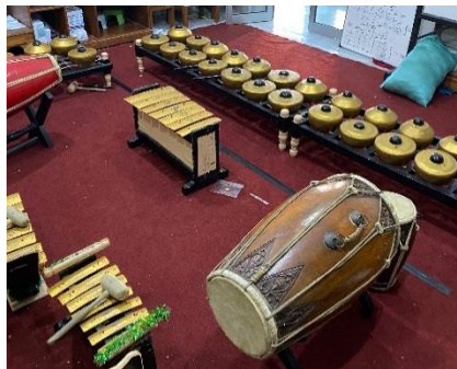
Gambar 3. Karawitan SD 1 Barongan Kudus

Implementasi kendang dalam pembelajaran Seni Budaya di SD 1 Barongan Kudus memperlihatkan bahwa kendang tidak hanya dikenalkan sebagai alat musik tradisional pengatur irama dan tempo dalam karawitan, tetapi juga dimanfaatkan sebagai media pembelajaran yang menjadikan proses belajar lebih kontekstual dan bermakna. Guru Seni Budaya mengenalkan struktur kendang serta teknik dasar memainkannya secara bertahap melalui kegiatan pembelajaran dan latihan yang berkesinambungan, sehingga peserta didik terlibat aktif dalam pengalaman bermusik yang dekat dengan budaya lokal. Model pembelajaran ini selaras dengan hasil penelitian mengenai penggunaan alat musik tradisional di sekolah dasar, yang menunjukkan bahwa media seni tradisional mampu meningkatkan keterlibatan siswa secara menyeluruh, mencakup aspek kognitif, afektif, dan psikomotorik (Budi et al., 2025).