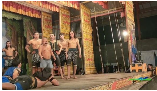
Gambar 4. Wayang kepruk

Adean Wayang Kepruk menjadi salah satu bagian yang paling diminati oleh penonton karena menampilkan unsur seni bela diri yang dikombinasikan dengan elemen dramatik. Gerakan-gerakan silat yang lincah menggambarkan semangat kepahlawanan, keberanian, dan ketangkasan tokoh dalam cerita (D. Wijayanto et al., 2023). Unsur ini menunjukkan bahwa Kethoprak Wahyu Manggolo tidak hanya menonjolkan aspek estetika, tetapi juga menghadirkan kekuatan fisik dan moral yang menjadi karakteristik seni rakyat Jawa. Menurut Oktavia & Sudrajat (2024), elemen bela diri dalam seni pertunjukan tradisional berfungsi sebagai simbol kekuatan spiritual dan keteguhan moral masyarakat.