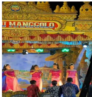
Gambar 5. Tamansari

Adean Wayang Kepruk menjadi salah satu bagian yang paling diminati oleh penonton karena menampilkan unsur seni bela diri yang dikombinasikan dengan elemen dramatik. Gerakan-gerakan silat yang lincah menggambarkan semangat kepahlawanan, keberanian, dan ketangkasan tokoh dalam cerita (D. Wijayanto et al., 2023). Unsur ini menunjukkan bahwa Kethoprak Wahyu Manggolo tidak hanya menonjolkan aspek estetika, tetapi juga menghadirkan kekuatan fisik dan moral yang menjadi karakteristik seni rakyat Jawa. Menurut Oktavia & Sudrajat (2024), elemen bela diri dalam seni pertunjukan tradisional berfungsi sebagai simbol kekuatan spiritual dan keteguhan moral masyarakat.