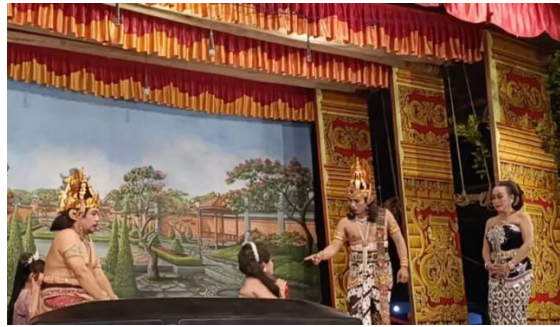
Gambar 7. Pemain ketoprak wahyu manggolo

Proses rekrutmen pemain dalam Wahyu Manggolo bersifat terbuka dan mengutamakan minat serta komitmen terhadap seni tradisional. Banyak anggota baru berasal dari kalangan muda yang awalnya hanya penonton setia lalu tertarik untuk ikut bergabung setelah menyaksikan pementasan secara langsung. Mereka diterima tanpa seleksi formal, tetapi tetap melalui tahap pembinaan dan latihan rutin untuk mengenal dasar-dasar peran dan etika pertunjukan (Dewi, 2023). Pola rekrutmen seperti ini sejalan dengan konsep cultural apprenticeship yang menekankan pembelajaran berbasis praktik dan pengamatan langsung dari senior. Dengan demikian, sistem keanggotaan yang terbuka tidak hanya memperkuat regenerasi seniman, tetapi juga menjadi model pelestarian budaya yang berkelanjutan.