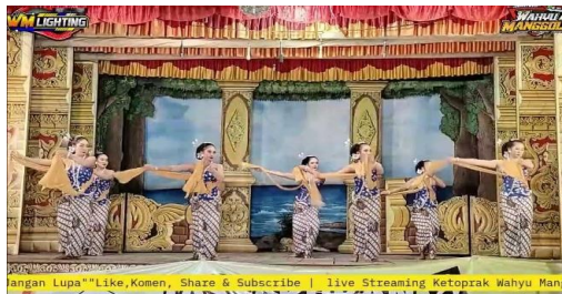
Gambar 3. Tari Gambyong

Adapun daya tarik utama kelompok ini terletak pada empat segmen unggulan yang selalu dinanti penonton, yaitu Tari Gambyong, Wayang Kepruk, Tamansari, dan Dagelan. Keempat segmen ini memperlihatkan kombinasi antara keindahan, aksi, dan humor yang mencerminkan keseimbangan antara estetika dan hiburan. Tari Gambyong misalnya, menjadi simbol keanggunan dan keselarasan gerak yang berpadu dengan gending karawitan yang megah. Sementara Wayang Kepruk menampilkan unsur seni bela diri yang dikemas akrobatik untuk memperkuat dinamika panggung. Tamansari menonjolkan unsur vokal dan interaksi penonton melalui lagu campursari dan dangdut, sedangkan Dagelan menghadirkan komedi sosial yang relevan dengan isu kehidupan sehari-hari (D. Wijayanto et al., 2023). Kombinasi tersebut menjadi kekuatan utama yang membuat Wahyu Manggolo tetap digemari di tengah arus hiburan modern.