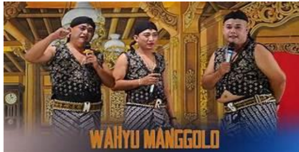
Gambar 6. Dagelan

Tamansari bukan hanya hiburan, melainkan media apresiasi terhadap peran perempuan dalam seni pertunjukan tradisional.