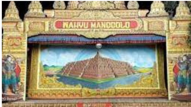
Gambar 8. Panggung