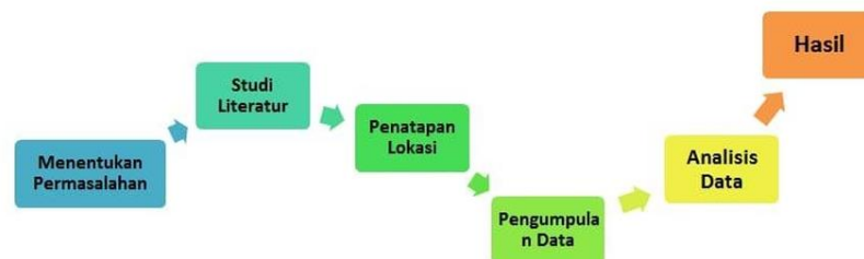
Gambar 1. Analisis Data Miles dan Huberman (W. Wijayanto & Fidyastuti, 2025)

Penelitian ini menggunakan metode kualitatif deskriptif, yang menekankan pada pemahaman makna fenomena sosial berdasarkan perspektif subjek penelitian di lapangan (Z, 2022). Metode ini berfokus pada upaya menggambarkan kondisi nyata sebagaimana adanya melalui proses pengumpulan data mendalam, observasi, wawancara, serta dokumentasi (Septiana et al., 2022). Pendekatan ini relevan digunakan untuk menelusuri proses adaptasi dan dinamika kelompok Kethoprak Wahyu Manggolo sebagai bagian dari pelestarian budaya di tengah modernisasi. Penelitian dilakukan di Desa Tanjungsari, Kecamatan Jakenan, Kabupaten Pati, Jawa Tengah, pada Maret sampai oktober 2025, dengan informan utama berupa pimpinan dan anggota kelompok. Data dianalisis menggunakan model Miles dan Huberman yang mencakup tiga tahap utama: reduksi data, penyajian data, dan penarikan kesimpulan (Miles et al., 2014). Untuk menjaga keabsahan data, digunakan teknik triangulasi sumber dan metode, sehingga hasil penelitian diharapkan memberikan pemahaman komprehensif tentang sejarah, sistem keanggotaan, serta strategi adaptasi kethoprak terhadap perubahan sosial budaya (Creswell, 2018). Berikut disajikan bagan alur dalam penelitian ini sebagai berikut.