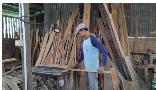
Gambar 5. Teknik Pembuatan

proses pembuatan kerajinan seni ukir yaitu pahat, gergaji, pengikis, pisau, parang, amplas, palu, kuas, kompresor. Alat-alat yang sederhana mampu menciptakan hasil karya yang menawan melalui penerapan teknik tradisional. Keahlian para pengukir di Nalumsari ini diwariskan secara turun temurun, sehingga nilai-nilai budaya lokal dan karakteristik khas kota Jepara terpelihara dengan baik.