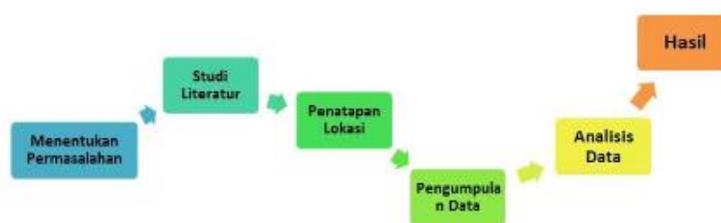
Gambar 1. Bagan Alur Penelitian

Metode penelitian yang digunakan adalah metode kualitatif dengan metode studi kasus. Penelitian kualitatif adalah penelitian yang dilaksanakan dalam kondisi alamiah dengan tujuan memahami dan menafsirkan berbagai fenomena yang terjadi. Penelitian kualitatif ini lebih mementingkan ketepatan dan kecukupan data (Adlini et al., 2022). Studi kasus dipilih untuk memperoleh pemahaman mendalam tentang fenomena spesifik mengenai manifestasi nilai budaya dalam ukiran pendapa di Nalumsari. Subjek penelitian yang digunakan adalah pengrajin seni ukir pendapa di Nalumsari jepara.