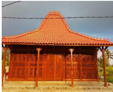
Gambar 3. Pendapa

Jepara merupakan salah satu Kabupaten di Provinsi Jawa Tengah yang terkenal dengan kekayaan budaya dalam bidang seni ukir kayu. Jepara dijuluki sebagai “Kota Ukir” karena mayoritas penduduknya mahir mengukir kayu. Seni ukir jepara memiliki sejarah panjang dan telah dipengaruhi oleh berbagai peradapan serta agama yang datang ke Indonesia, termasuk budaya Cina, Eropa, Hindu, budha, dan Islam. Tradisi ini konon bermula sejak abad ke-7, ketika etnis Tionghoa pertama kali tiba di Kerajaan kalingga, yang kini berada di Wilayah Keling. Jejak tradisi mengukir tertinggal pada prasasti Sojomerto (Prasiska & Wati, 2024). Bentuk dan motif ukiran klasik Jepara umumnya terdiri atas bentuk pokok, buah wuni, dan lemahan atau dasar ukiran. (Prasiska & Wati, 2024).