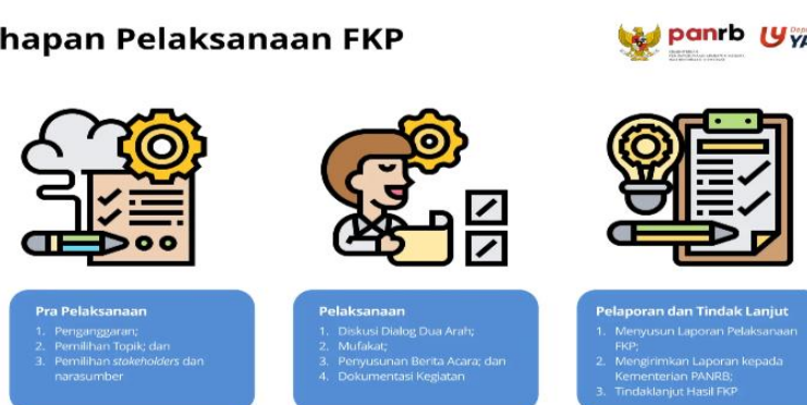
Gambar 2 Tahapan Pelaksanaan FKP