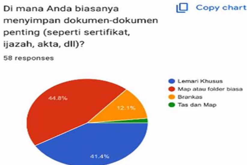
Diagram 1. Responden melakukan penyimpanan dokumen

Dari 58 responden, tempat penyimpanan dominan yang digunakan adalah map atau folder biasa 44,8% dan lemari khusus 41,4%. jika digabungkan, sekitar 50 orang yang mengandalkan metode penyimpanan yang mudah diakses di rumah. Untuk responden yang menggunakan penyimpanan brankas hanya 12,1% yang menawarkan tingkat keamanan yang lebih tinggi untuk memproteksi terjadinya bencana (kebakaran, atau banjir) dan pencurian. Lalu untuk penyimpanan yang tidak sistematis yaitu penggunaan tas dan map lebih kecil sekitar 1,7%. Secara umum, mayoritas memilih kepraktisan dan kemudahan aksesibilitas yaitu penyimpanan map atau folder dan lemari khusus dibanding penawaran keamanan yang lebih tinggi.