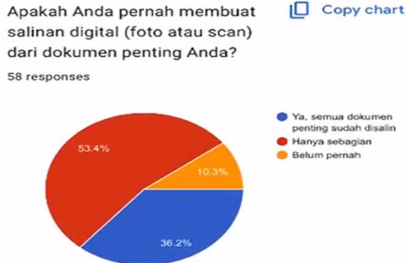
Diagram 3. Alih media ke digital Sumber. Data primer hasil kuesioner

Dengan demikian, pengelolaan arsip dilakukan agar informasi didalamnya dapat ditemukan secara cepat dan digunakan sesuai kebutuhannya. Adanya permasalahan yang dialami oleh masyarakat dalam kegiatan temu kembali menjelaskan bahwa tujuan utama pelaksanaan pengelolaan arsip serta kebergunaan arsip belum terpenuhi dengan baik. Suatu kegiatan dilakukan dengan tujuan tertentu, dengan belum tercapainya tujuan tersebut, maka diperlukan peninjauan ulang terhadap proses yang berjalan, termasuk identifikasi hambatan serta penyesuaian langkah agar tujuan tersebut dapat tercapai secara optimal.