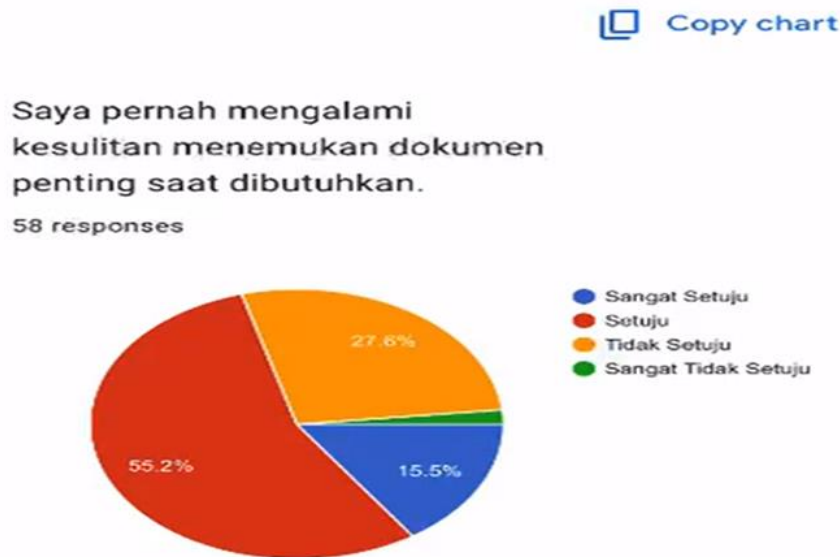
Diagram 2. Temu kembali