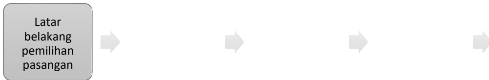
Gambar 1. Persepsi laki-laki Suku Jawa terhadap Uang Panai'