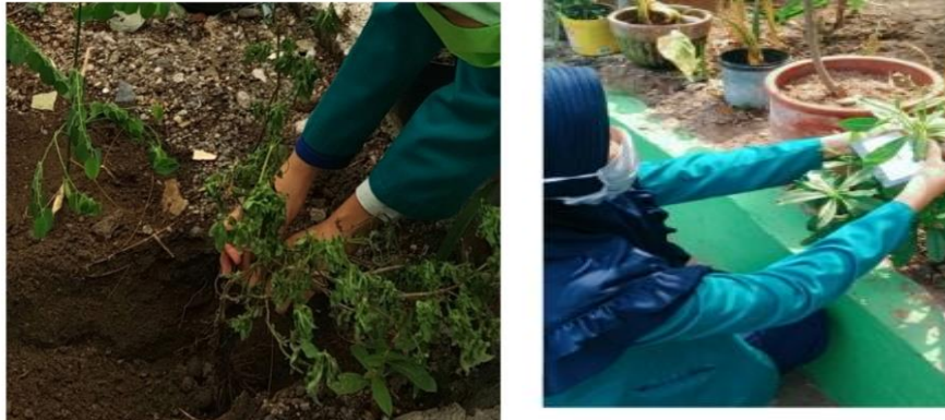
Gambar 4. Penanaman Sayur dan Obat-Obatan

Kegiatan ini berjalan dengan lancar. Semua peserta sangat antusias mengikuti rangkaian acara. Banyak dari ibu PKK tersebut ingin menerapkan RPL untuk memenuhi kebutuhan pangan keluarga mereka, dan sangat bersyukur jika bisa menjadi sumber pendapatan tambahan keluarga. Sasaran yang ingin dicapai dari kegiatan RPL adalah berkembangnya kemampuan keluarga dan masyarakat secara ekonomi dan sosial dalam memenuhi kebutuhan pangan dan gizi secara lestari, menuju keluarga dan masyarakat yang sejahtera, terwujudnya diversifikasi pangan, dan pelestarian tanaman pangan lokal.