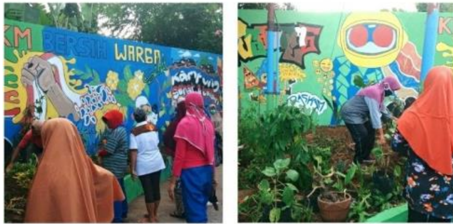
Gambar 2. Foto Pembersihan Lahan

Rangkaian acara pengabdian ini yaitu pertama edukasi terkait program RPL yang dikembangkan oleh dinas pertanian. Dalam edukasi ini dijelaskan bagaimana memanfaatkan lahan pekarangan mulai dari persiapan lahan, jenis-jenis media tanam, pemilihan tanaman, dan perawatan pasca tanam. Rangkaian acara kedua yaitu penanaman sayur dan obat di tanah kosong yang ada di Aula Kantor Lurah Cakranegara Selatan Baru. Sebelum dilakukan penanaman, semua warga bergotong royong membersihkan lahan yang dipakai percontohan. Setelah itu, dilakukan penanaman bibit sayur yang sebelumnya sudah tersedia di polibag. Bibit sayur ini kebetulan sudah ada di salah satu rumah warga yang memang mengembangkan RPL. Berikut foto kegiatan yang dilakukan: