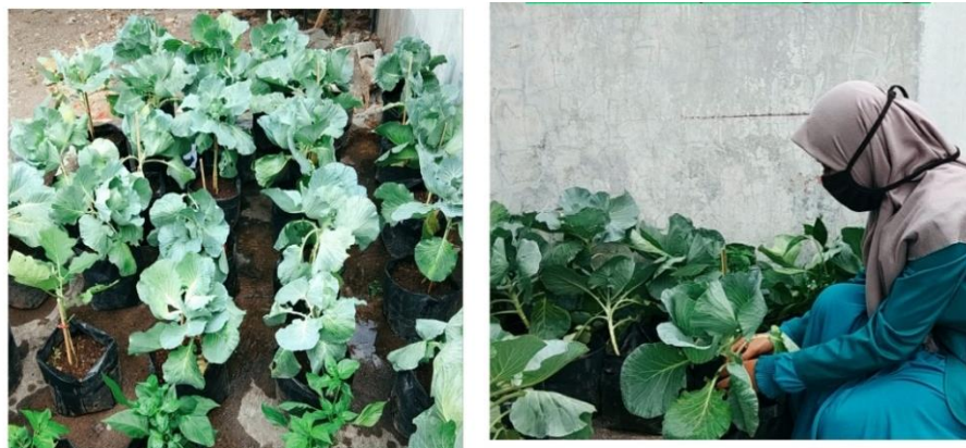
Gambar 3. Benih Tanaman di Salah Satu Rumah Warga