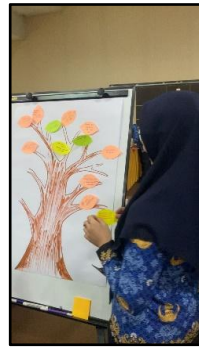
Gambar 10. Pemberian Refleksi oleh Peserta seminar di Pohon Harapan

Rangkaian kegiatan terakhir adalah peserta diminta untuk menuliskan hasil refleksi yang diperoleh setelah menyimak materi terkait workplace spirituality pada secarik kertas berwarna ( sticky notes ) berbentuk daun setelah itu menempelkannya pada papan yang bergambar pohon. Diharapkan hasil refleksi atau nilai-nilai positif yang diperoleh dari materi seminar dapat selalu diingat dan diimplementasikan pada kegiatan pegawai saat bekerja.