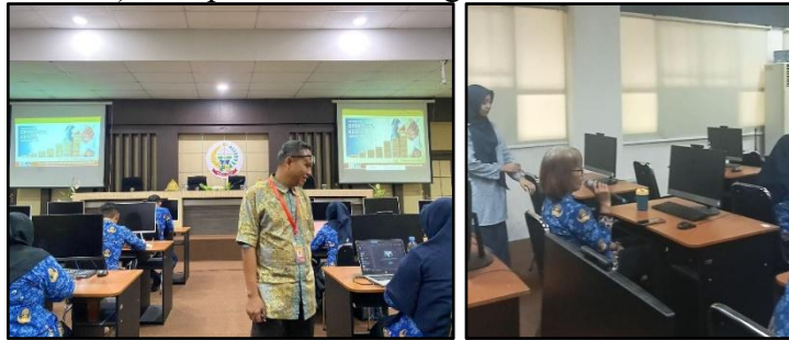
Gambar 7. Diskusi

yakni selama 60 menit. Materi yang diberikan terdiri dari konsep spiritualitas kerja; kekuatan spiritual; korelasi spiritual dan organisasi; etika spiritual kerja; posisi spiritual dalam kerja yang terkait dengan fungsi psikis yakni kognisi (IQ), afeksi (EQ), dan psikomotorik ( skill ); penjelasan mengenai pengaruh bio-psiko (aku) dan sosial (lingkungan) terhadap spiritual (tuhan); penjelasan mengenai kerja integrasi 3 komponen yakni SQ (kecerdasan spiritual), EQ (kecerdasan emosi), dan IQ (kecerdasan intelektual); dan pemberian renungan.