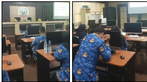
Gambar 8. Post-test

Setelah penyampaian materi, dibuka forum diskusi untuk mendiskusikan pengalaman peserta dan tanya jawab mengenai hal-hal yang masih belum dimengerti oleh peserta.