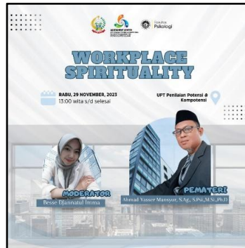
Gambar 3. Pamflet Kegiatan

Tahap pertama adalah merancang kegiatan psikoedukasi dengan mempertimbangan kebutuhan pegawai yakni dengan melakukan analisis kebutuhan. Tahapan merancang kegiatan seminar psikoedukasi dilakukan dengan menentukan tema serta topik yang akan dibawakan, merumuskan permasalahan dan tujuan utama dari kegiatan, dan mendiskusikan materi yang akan disampaikan oleh narasumber. Rancangan kegiatan seminar psikoedukasi juga termasuk merancang pamflet kegiatan, pembentukan panitia, susunan acara, dan membuat refleksi dalam bentuk pohon harapan.