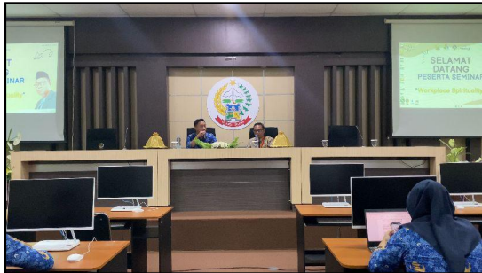
Gambar 5. Pembukaan dan Pre-test

Persiapan yang dilakukan sebelum dilaksanakannya acara yaitu melakukan registrasi terhadap peserta.