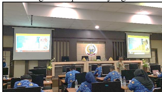
Gambar 9. Penutupan

Setelah diskusi dan peserta memahami isi materi yang telah disampaikan, peserta kemudian diarahkan untuk mengisi link post-test yang telah disediakan.