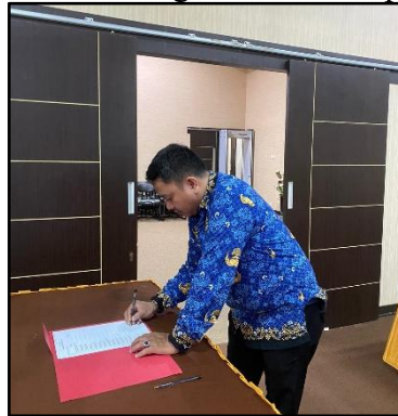
Gambar 4. Registrasi Peserta

Pelaksanaan kegiatan didasari pada susunan acara kegiatan dengan dipandu oleh MC. Berikut merupakan dokumentasi kegiatan seminar psikoedukasi: