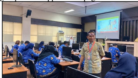
Gambar 6. Pemberian Materi

Setelah registrasi, peserta kemudian diarahkan untuk duduk di kursi yang telah disediakan di ruang CAT UPT, dilanjutkan pembukaan acara seminar dengan resmi oleh kepala UPT, kemudian setelah itu peserta diarahkan untuk mengisi link pre-test yang disebar melalui group WhatsApp seluruh pegawai UPT.