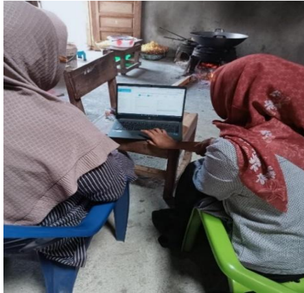
Gambar 1. Sosialisasi kepada Mitra IKM tentang optimalisasi produk melalui perizinan P-IRT