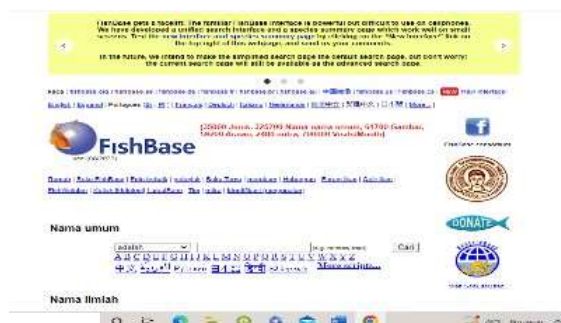
Gambar 2. Website Fishbase

Ikan hasil tangkapan akan dilakukan sampai tingkat spesies dengan mengacu pada Buku Identifikasi Jenis Ikan (Wahyu Furqon, 2015). Selain dari buku, identifikasi juga di lakukan dengan menggunakan website identifikasi www.fishbase.org (Froese dan Pauly, 2022).