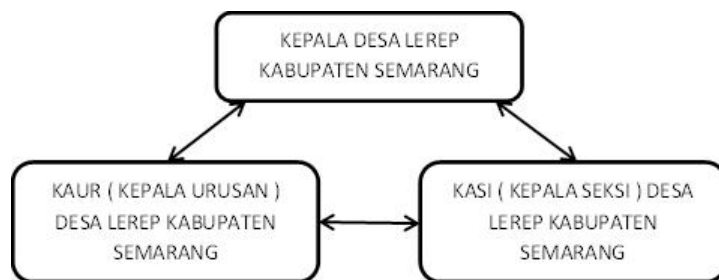
Gambar 2 Triagulasi Sumber