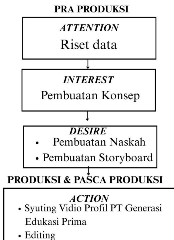
Gambar 1. Prosedur kerja produksi video profil PT Generasi Edukasi, 2025

pesan yang disampaikan dapat diterima secara efektif oleh audiens Dengan penerapan model AIDA dalam proses kreatif penulisan naskah, model AIDA akan memperjelas konsep perubahan, sikap, dan perilaku dalam kaitannya dengan kerangka tindakan. Dalam praktiknya, minat beli dipengaruhi oleh model AIDA, terutama pada konsep perhatian, ketertarikan, dan keinginan karena hal-hal tersebut berkaitan dengan faktor psikologis yang muncul dalam diri seseorang, yang pada akhirnya akan mengarah pada minat untuk membeli (Insani et al. 2024:3) video profil PT Generasi Edukasi Prima diharapkan mampu memperkuat identitas perusahaan, meningkatkan kepercayaan masyarakat, serta memperluas jaringan kerja sama secara berkelanjutan melalui komunikasi visual yang informatif dan estetis.