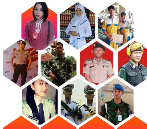
Gambar 6. Lulusan SMK Tinta Emas Indonesia

bahwa sekolah ini menawarkan pendidika berkualitas tinggi yang dapat membantu siswa mengembangkan keterampilan di dunia kerja.