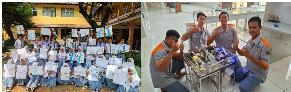
Gambar 5. Hasil Sikap Akuntabel dalam Pembelajaran

Hasil dari tanggung jawab perilaku ini dapat dilihat dari capaian pembelajaran yang jelas, keterampilan praktis yang unggul, dan kontribusi yang signifikan bagi lembaga pendidikan. sebagai ilustrasi, generasi z dinamis dan membentuk suasana pendidikan yang konstruktif dengan mengumpulkan informasi dan ikut serta dalam aktivitas akademik, mendapatkan wawasan dari alumni, serta menilai program pendidikan yang memenuhi kriteria akreditasi institusi. Disamping itu, mereka juga berperan dalam tanggung jawab kolektif.