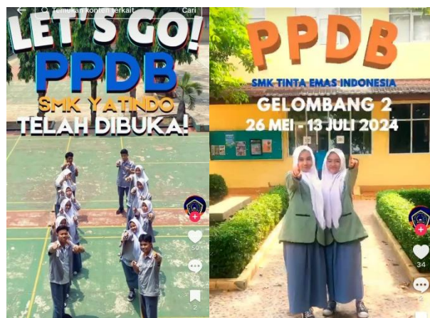
Gambar 4. Konten Kreatif Siswa dalam Promosi Sekolah

Generasi yang terbiasa dengan teknologi memiliki kemampuan untuk menggunakan berbagai media digital dengan lancar, seperti Instagram, Tiktok, dan situs web sekolah. Mereka memanfaatkan media tersebut untuk serta dalam kegiatan seperti membagikan informasi tentang event sekolah, menyampaikan kabar terkait pembelajaran, serta mempresentasikan program-program unggulan dengan cara yang menarik. Mereka juga mampu menghasilkan gambar, video dan grafik yang edukatif serta menarik perhatian Masyarakat, khususnya calon siswa. Hal ini menunjukkan bahwa generasi z tidak sekedar kelompok yang mengandalkan teknologi, tetapi juga secara proaktif dan positif menyebarkan informasi tentang sekolah mereka. Kolaborasi dan imajinasi mereka memungkinkan pemanfaatan perangkat digital yang efektif dan efisien untuk meningkatkan jumlah sekolah inovatif. Partisipasi aktif generasi z, terutama dalam mempromosikan sekolah melalui platform media sosial, berdampak positif dalam menciptakan lingkungan belajar yang dinamis, kreatif dan relevan. Hal ini dengan jelas menggambarkan kebutuhan generasi z untuk membantu sekolah menjadi lebih kompetitif di era digital. Partisipasi aktif tersebut telah membuahkan hasil positif, seperti informasi yang transparan dan kegiatan belajar yang bertanggung jawab.