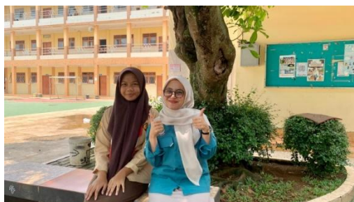
Gambar 2. Narasumber Ke-2

Narasumber Ke-2 (XII): ”...peran saya sebagai siswa aktif selain belajar salah satunya ya memantau informasi mbak. Kalau misal ada biaya yang nggak paham itu untuk apa aja kita bisa tanya atau kritik. Menurut saya itu udah termasuk membantu membangun kepercayaan sekolah juga si.”