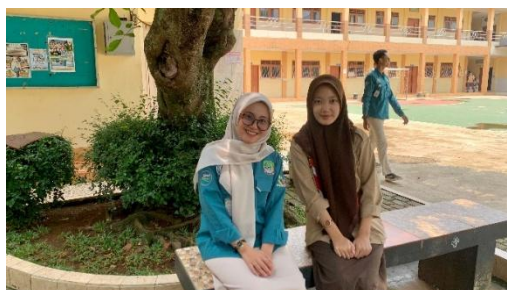
Gambar 1. Narasumber Ke-1

Narasumber Ke 1 (XI): “...kalau menurut aku pribadi ya mbak, informasi tentang biaya disini sih udah jelas. Karenakan dari awal pendaftaran sampe udah masuk sekolah pun biaya dirinciin trus sering di share juga. Tapi kadang ada biaya tambahan yang kasih tau nya tiba-tiba. Kan kalau diinformasi dari jauh-jauh hari mungkin orang tua saya ada persiapan ya.”